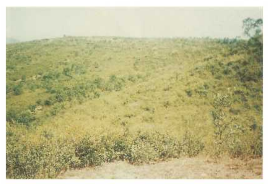
Hồ Từ Lâm (hộ sâu) Thế Lới - Đia điểm đại hội Đảng bộ Tinh Phong lần thủ nhất, ngày 3/2/1961