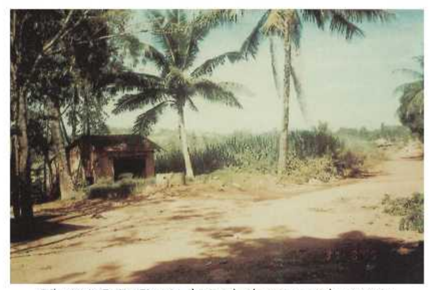
Giếng gạch (Tường Thọ) nơi kể thủ phát đến tội trong nhiều trận đi cán quat vi bị vượng min đo dụ kích bộ trị sắn, thời kỳ kháng chiến chông Mỹ