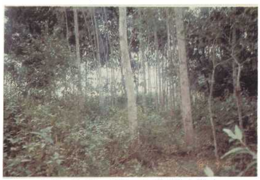
Sau Định Diễn Phước - Thế Lợi - địa điểm Hồi nghi Tỉnh ủy vào tháng 3/1931