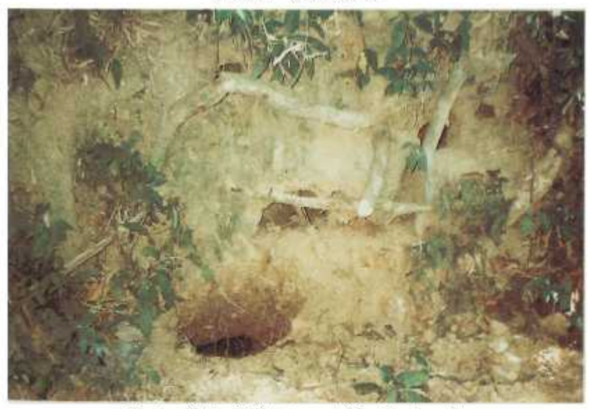
Địa đầu ở thôn Thế Lại trong chống Mỹ cứu nước