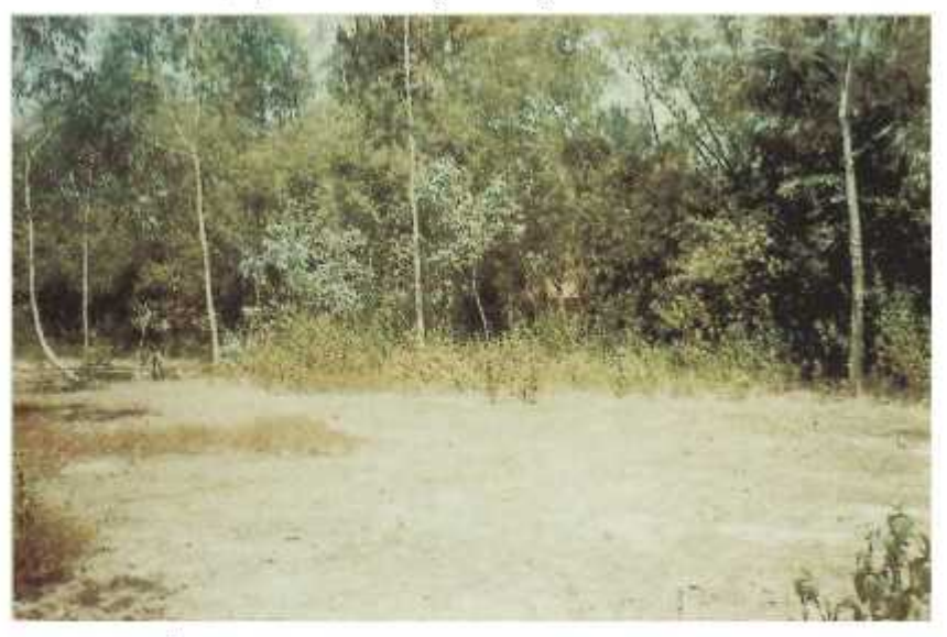
Più diểm Đài hệ Đàng bố xã Tinh Phong lần thứ 2 năm 1949 lại thôn. Thể Long